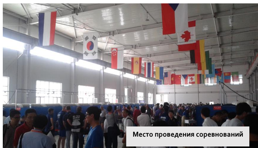
Место проведения соревнований